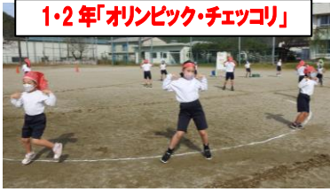
1・2年「オリンピック・チェッコリ」