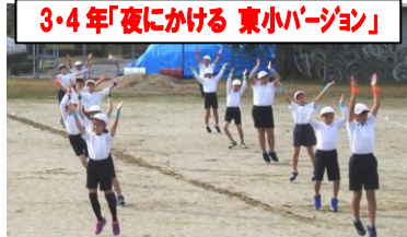
3・4年「夜にける 東小バージョン」